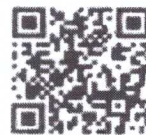
ฐานข้อมูลบัญชีกำหนดสื่อการเรียนรู้ สำหรับเลือกใช้ในสถานศึกษา