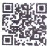
แนวทางการดำเนินงาน

รายละเอียดแนวทางการดำเนินงานโครงการสนับสนุนค่าใช้จ่ายในการจัดการศึกษาตั้งแต่ระดับอนุบาลจนจบการศึกษาขั้นพื้นฐาน ปีงบประมาณ พ.ศ. ๒๕๖๗ ตาม QR Code ที่แนบท้ายนี้