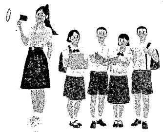
กลุ่มพัฒนาคุณภาพและมาตรฐานการศึกษา