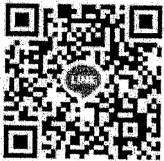
QR Code สำหรับส่งใบสมัคร